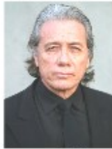
Edward James Olmos